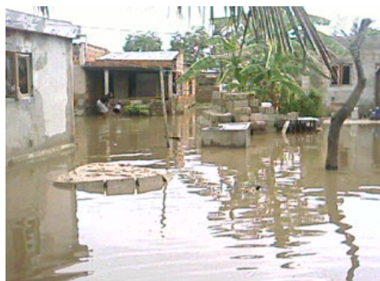
Recinto de uma casa inundada em Inhagoia (Maputo)

Infulene, Inhagoia, George Dimitrov (Benfica), 25 de Junho (Choupal), Maxaquene, Liberdade, Mafalala, são entre outros, os bairros que ficaram mais afectados.